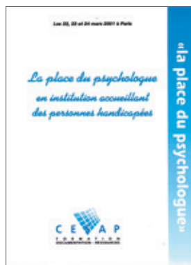
La place du psychologue en institution accueillant des personnes polyhandicapées (mars 2001) 19 €