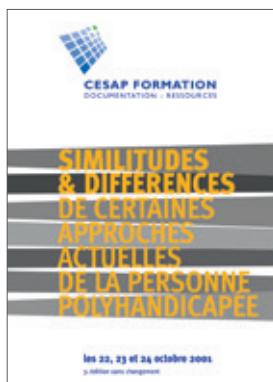
Similitudes et différences de certaines approches actuelles de la personne polyhandicapée. Actes des journées des éducateurs (octobre 2001) 19 €