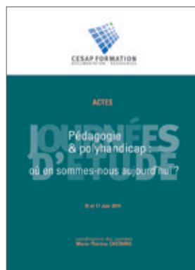
Pédagogie et polyhandicap : où en sommes-nous aujourd'hui ? (16 et 17 juin 2014) 25 €