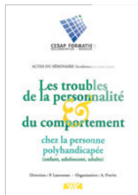
Les troubles de la personnalité et du comportement chez la personne polyhandicapée (janvier 1996) 19 €