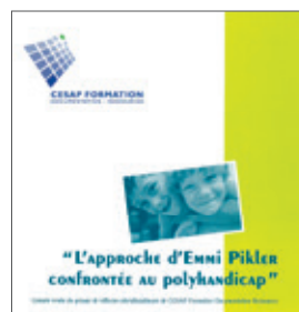
L'approche d'Emmi Pikler confrontée au polyhandicap (mars 2008) 24 €