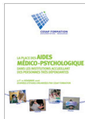
La place des aides médico-psychologiques dans les institutions accueillant des personnes très dépendantes (novembre 2006) 19 €