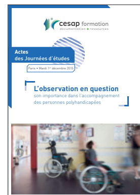
L'observation en question, son importance dans l'accompagnement des personnes polyhandicapées (1 er décembre 2015) 25 €