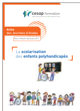
La scolarisation des enfants polyhandicapés (5 décembre 2017) 25 €