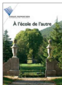
DVD vidéo À l'école de l'autre. Un regard sur la pratique du Snoezelen (octobre 2011) 22 €