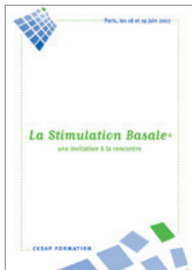
La stimulation Basale® une invitation à la rencontre (juin 2007) 19 €