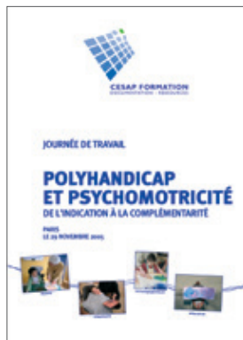
Polyhandicap et psychomotricité : de l'indication à la complémentarité (novembre 2005) 19 €