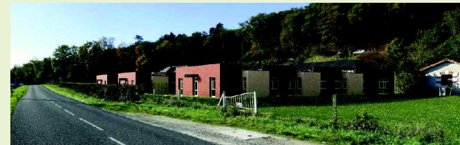
La future MAS ... image d'architecte !

Mardi 18 décembre 2018 nous posions la "première pierre" de la future nouvelle Maison d'Accueil Spécialisée du Château de Launay