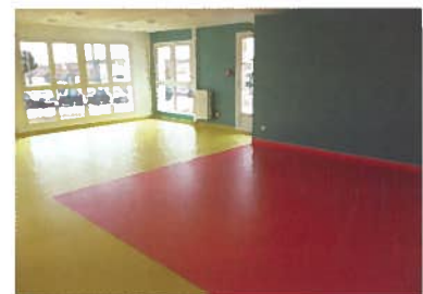
Des salles de groupes... à aménager !

En 2010, lors de sa séance du 2 avril, le dernier " Comité régional de l'organisation sociale et médico-sociale " d'Île de France (les " CROSMS " ont désormais disparu au profit du système des " appels à projet ") autorise une réorganisation du CAFS et de l'EME et favorise ainsi la création d'une nouvelle extension : l'externat va pouvoir être construit : un comité de pilotage constitué de salariés et de la direction a donc " planché " avec l'architecte le temps nécessaire pour imaginer des locaux adaptés, au service des enfants. C'est ainsi qu'une salle de jeux d'eau avec geysers et flaques, une baignoire trèfle et une nouvelle salle Snoezelen ont vu le jour près de vastes salles de groupes (voir photos). ■